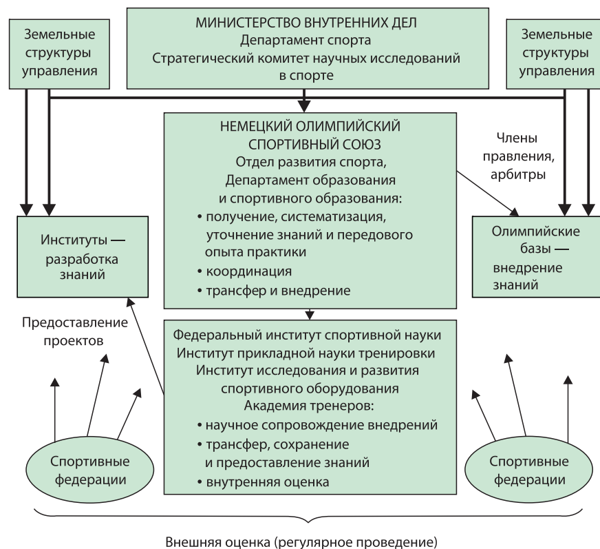
РИСУНОК 1 – Модель структуры «Научная кооперация в спорте высших достижений» (функции и связи): — финансирование; — кооперация, влияние на решения [14]

Активная деятельность ученых наблюдается в специальных организациях, занимающихся подготовкой национальных команд к Олимпийским играм. В работе Национального совета элитного спорта Австралии принимают участие руководство и представители институтов и академий спорта, Австралийской спортивной комиссии, Австралийского олимпийского комитета, Ассоциации Игр Содружества наций,