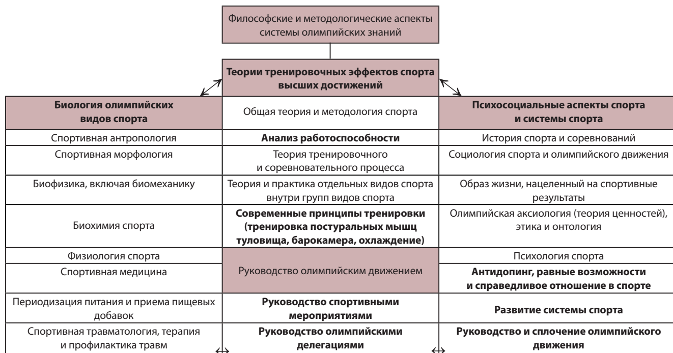
РИСУНОК 2 – Научная основа работы НОК Сербии, структура создания системы олимпийских знаний как ценностной категории современного олимпийского движения

более десятилетия, отражают специфику сербского общества — отсутствие определенного лидера, наличие нескольких центров изменений (неконсолидированная модель), государственный интервенционизм, который ведет к частичному ограничению автономии и своеобразия спорта.